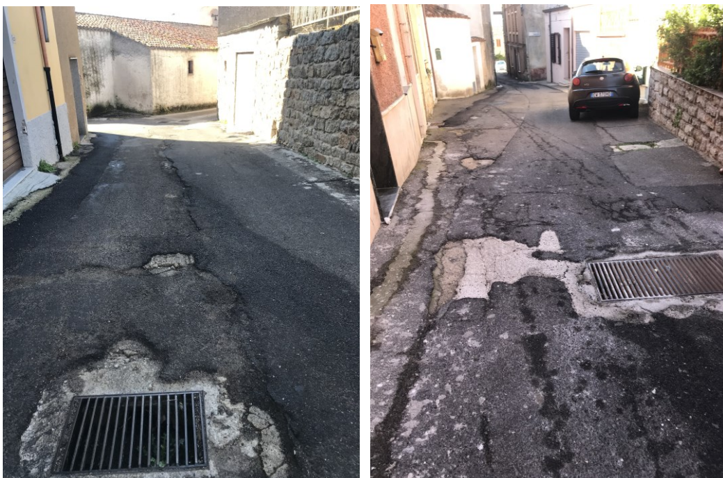
Foto della pavimentazione stato attuale